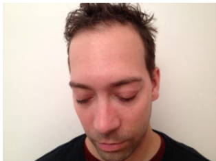
Tête vers le bas