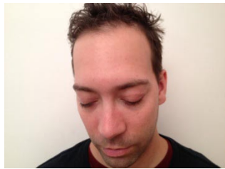
Tête vers le bas